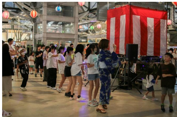
Re:盆プロジェクト 納涼祭