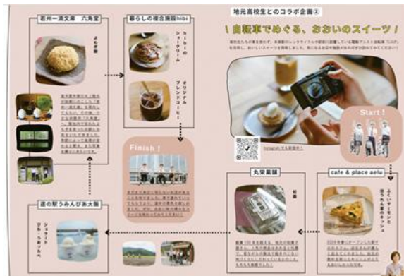
移住定住カルチャー誌「Ohi Time」 https://www.town.ohi.fukui.jp/newijuteiju/news/p24113.html