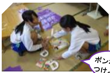
ポンポン玉 つけようっと