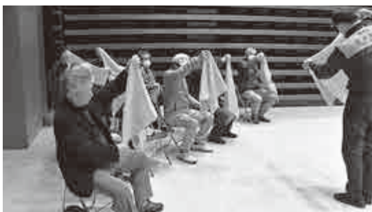
【 三角巾を用いた応急手当研修 】