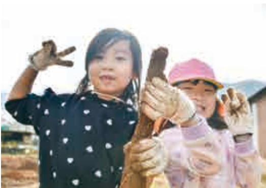
◆ 11月27日 名田庄こども園自然薯掘り

先輩方である名田庄自然薯生産組合が毎年開催している『じねんじょ祭り』にネオが参加すると、「若い壮年の人が参加してくれると頼もしい」と言ってもらえます。自然薯栽培に取り組む親の世代の背中を見ながら育ってきたので、「ネオの活動をやってきてよかった」と感じます。