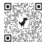
おい町役場 インスタグラム