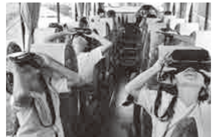
【 VR 見学の様子 】