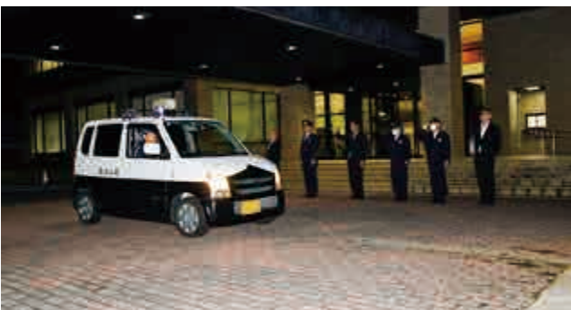
「おおい町防犯隊冬季防犯パトロール出発式」が行われました。おおい町防犯隊の皆さんが、町の安心、安全を守るため防犯パトロールを開始しました。(11月27日(木) おおい町役場)