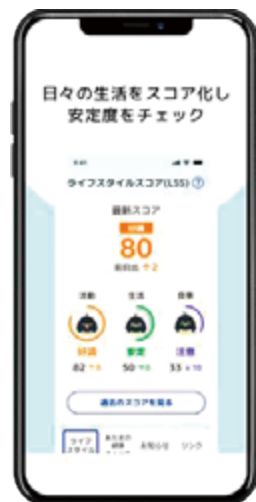
スマートフォン用 アプリ