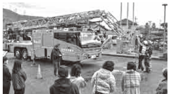
【 先端屈折式はしご車見学 】