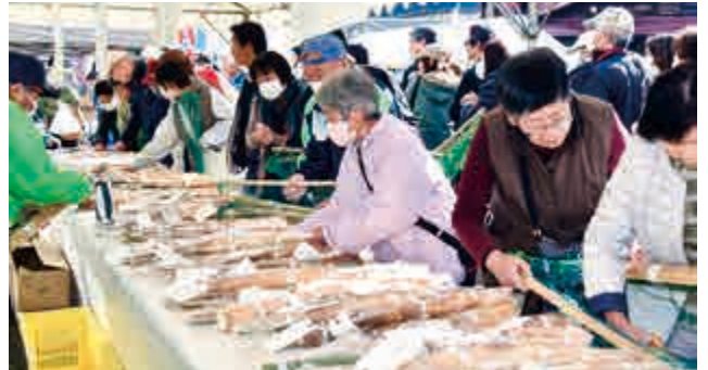
「第27回じねんじょ祭り」が開催されました。風味豊かな絶品の自然薯を求めて県内外から多くの人々が列をつくり、会場は大変賑わいを見せました。(11月23日(日) 名田庄あきない館)