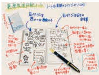
NPO法人森林楽校・森んこ 代表 萩原茂男

描くのは、ほとんどが朝。用事始めに書きます。朝に時間がないときは、その日は書きません。呑気で気ままな日記のようなものです。