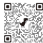
おい町役場 X(旧ツイッター)

町政情報やイベント情報などを、迅速に発信するために公式 SNS を運用しています。ぜひ、情報収集にご活用ください！