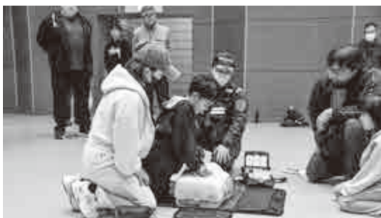
【 心肺蘇生研修 】

11月29日（土）と12月14日（日）に、総合町民センターと里山文化交流センター「ぶらっと」において自主防災組織等活動研修会が行われました。町内区民や自主防災組織員等が参加し、災害時の応急手当やAEDを活用した心肺蘇生、また、先端屈折式はしご車見学やエアートント内での煙体験など、災害対応力の向上を身に付けるための防災研修会を開催しました。参加者は、若狭消防署大飯分署・名田庄分署の職員指導のもと、日常生活にも役立つ実技の習得に向けて熱心に取り組みました。