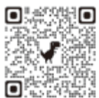
おい町役場 フェイスブック