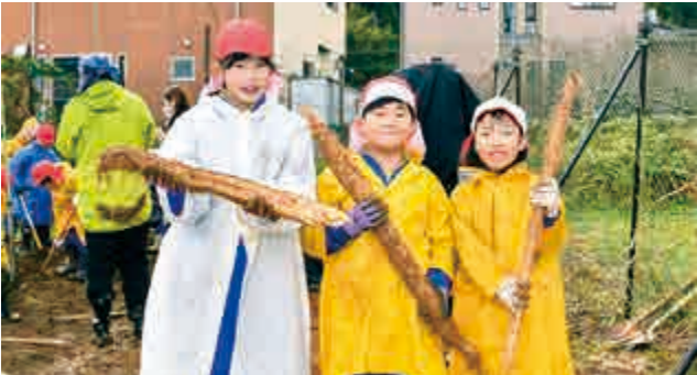
佐分利小学校の4・5年生たちが、町の特産品である自然薯の収穫体験を行いました。児童たちは、鍬とスコップを使い、大きく立派な自然薯を収穫していました。(11月26日(水) 鹿野区)