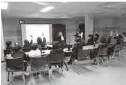
【 エネルギー教室の様子 】

大飯発電所は、今後もより発電所について知っていただき、親しみを感じていただけるよう取り組むとしています。