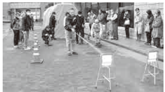
【 消火訓練 】