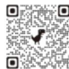
おい町役場 防災X(旧ツイッター)