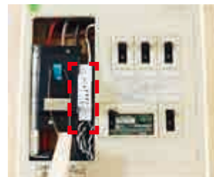
ブレーカーに設置した センサー

いつもと違う生活リズムの乱れや、活動の急激な変化を検知した際は、ご家族のスマートフォンに通知が届きます。本人が気づいていない小さな変化もいち早く察知することが可能です。