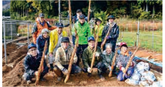
名田庄自然薯生産組合で栽培している自然薯の初掘りが行われ、長さ1メートル程に育った立派な自然薯約120本が次々に収穫されていました。(11月18日(火) 名田庄井上区)