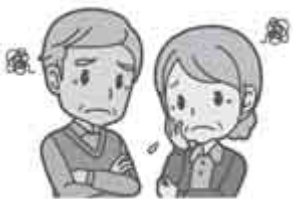
判断能力が不十分な人

このような判断能力が不十分な人の権利を守り、安心して生活が送れるように支援するのが成年後見制度です。