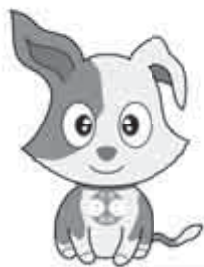
総務省行政相談センター