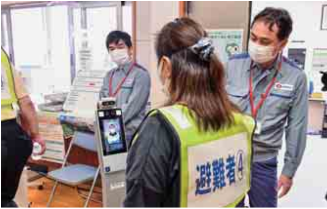
サーマルカメラによる検温をする訓練参加者