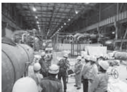
【1号機廃止措置工事状況】