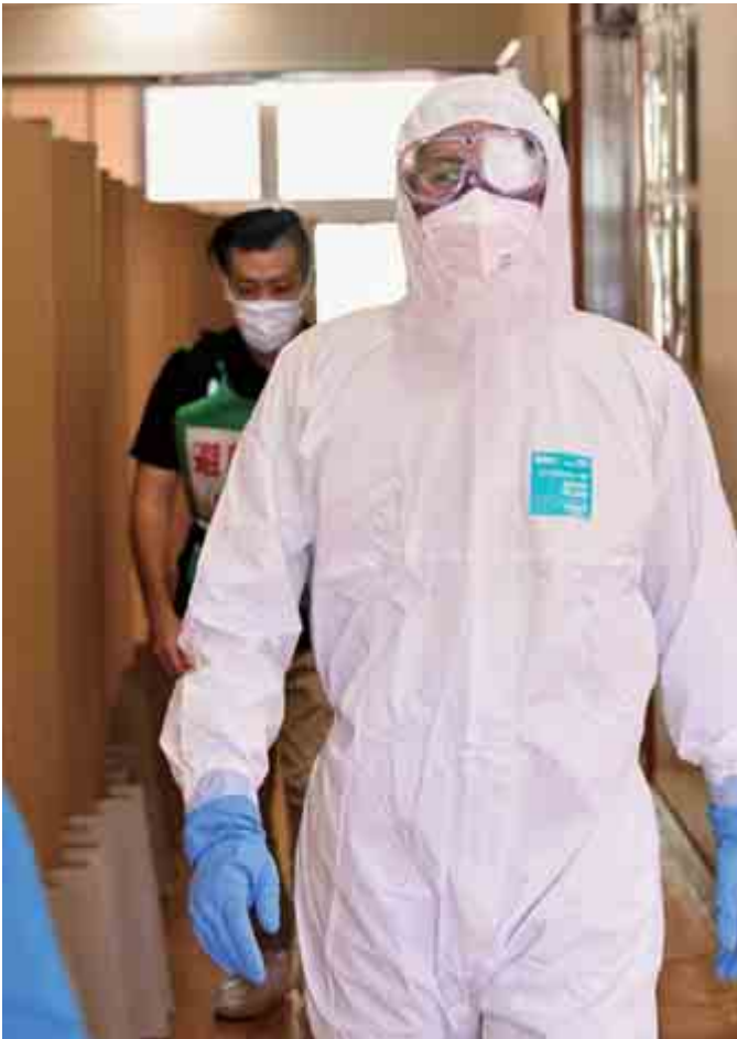
感染症疑い役の参加者を先導する職員