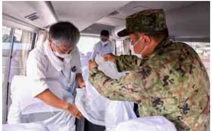
バスにおける飛沫感染防止対策を教える自衛隊員