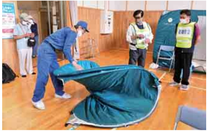
ワンタッチパーティションの立て方を実演する職員