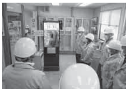
【出入管理所に設置されているサーモグラフィ】