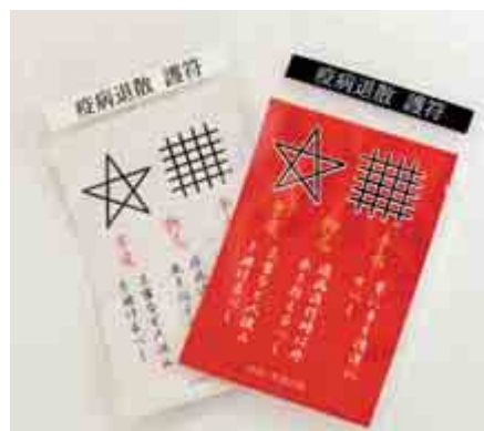
入館の際に渡される陰陽道護符

護符には、陰陽道にまつわる災禍より身を守る風習を感染症流行下である現代版に解釈した心得が書かれているほか、陰陽道で魔よけの意味のある『ドーマン(九字紋)』、『セーマン(五芒星)』が描かれています。 護符の配布の噂は口コミで広がり、初版版はすぐに在庫切れとなり、現在、約500枚が来館者に配布されています。