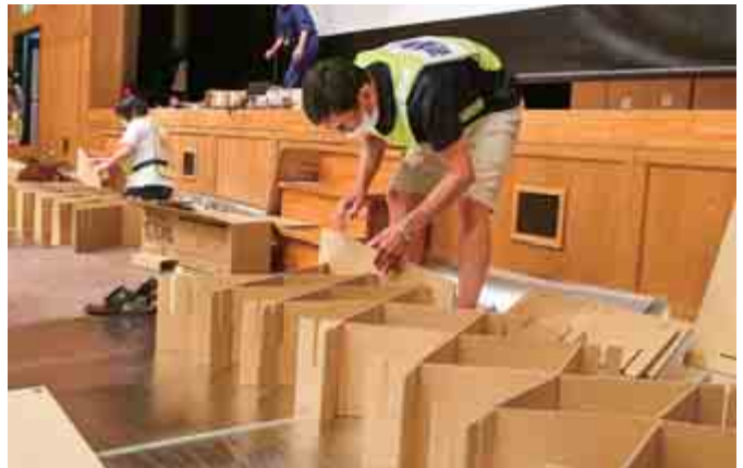
段ボールベッドを組み立てる訓練参加者

原子力防災センター運営訓練では、大飯・高浜の事故対応拠点が大飯に一元化する訓練や、被災の情報収集、防護措置の検討、住民の広域避難や屋内退避指示などの訓練を行いました。