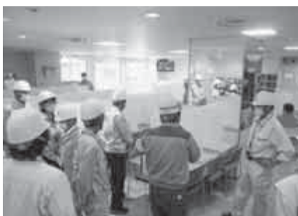
【食堂、喫煙所の新型コロナウイルス対策】