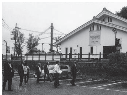
「チャレンジショップあすかむ」にて説明を受ける

これらを総合的に解決し明日香村の活性化を図るために「チャレンジショップあすかむ」が開設された。2年間のチャレンジ期間で達成目標に向かって事業展開を図っている。低家賃の設定と光熱水費を一部負担している。創業のための拠点として古民家を活用している。