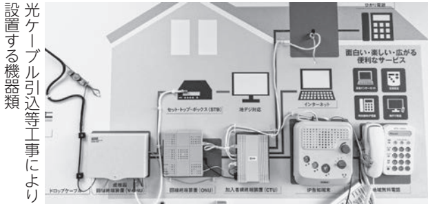
光ケーブル引込等工事により設置する機器類