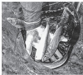
減少が危惧される南川の鮎

問 南川において6月2日に鮎釣り解禁されたが、今年は鮎の姿が見えず、鮎釣り客の姿もなかった。関係者にとっては死活問題であり、町にとっては重要な観光・産業資源である。現状の把握と今後の対策は。