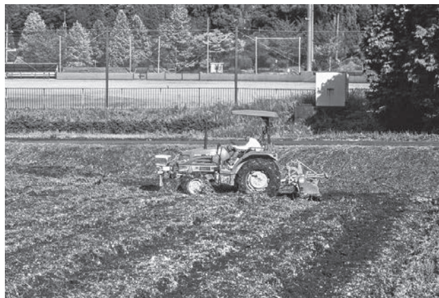
秋起こしで土づくり